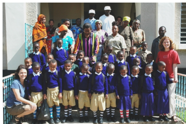
34 Erstklassler erhielten ihre erste Schulkleidung