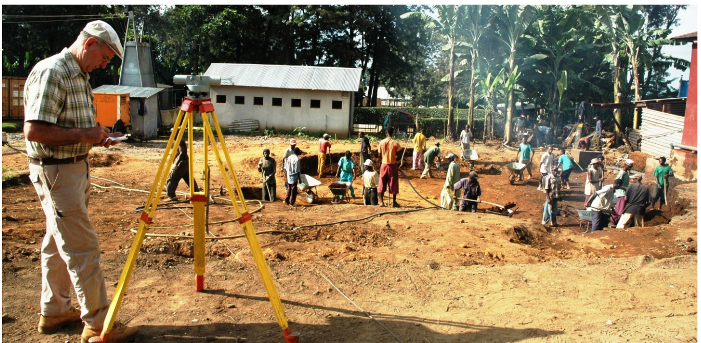
Bauingenieur Adolf Rudolf weist neue Wege: Der Neubau der Tagesklinik (OPD) im Kibosho Hospital wurde begonnen