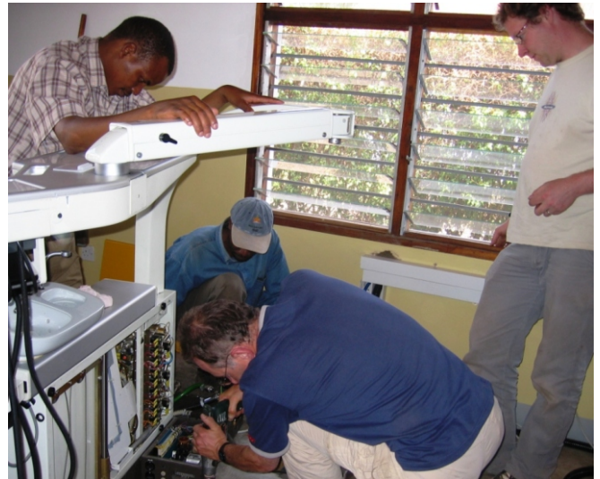
Familie Schenk auf Montage im Emmaus Centre in Sanya Juu

zur ortsnahen Versorgung der dortigen Bevölkerung eingerichtet, hier wurde die zweite Behandlungseinheit von Dr. Schneller installiert. Diese neue Zahnstation wird nun im Rahmen des Outreach Programms vom Zahnarzt aus Kibosho betreut.