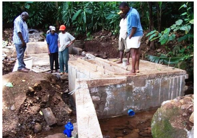
Quelfassung an der Chele Spring

In Mandaka gingen die schwierigen Bauarbeiten an der Quelfassung weiter. Im felsreichen Untergrund nahe der Quellen wurden Leitungsgräben ausgehoben und Rohrleitungen zum Tank I verlegt. Auch die Verbindungsleitung zwischen Tank I und Tank II ist im Bau. Durch den endgültigen Ausfall des von Kibosho angemieteten alten Benz-LKW wurde der Transport von Baumaterial an die verschiedenen Baustellen leider stark behindert, so das ein fremdes Fahrzeug angemietet werden musste.