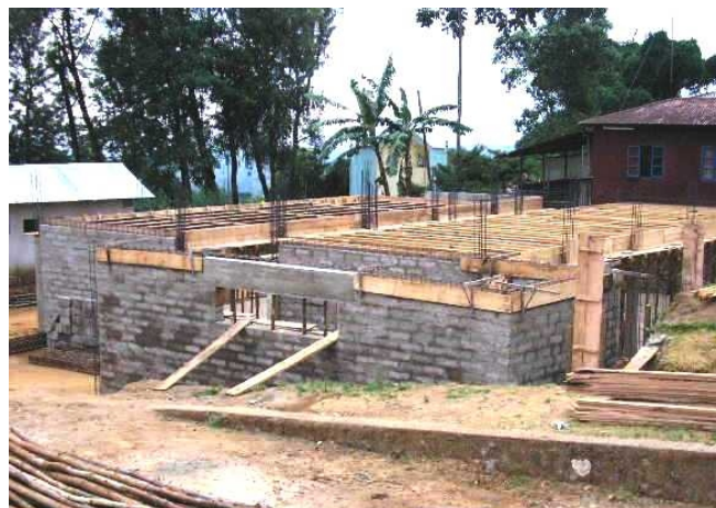
Rohbauarbeiten an der Tagesklinik

Familien leben von diesem Projekt. Bis zum Ende seines Arbeitseinsatzes Anfang April möchte Adolf Rudolf möglichst noch die Decke über das untere Geschoss betonieren. Dann wird die große Regenzeit den Bau erst einmal unterbrechen.